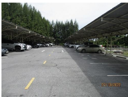
ภาพที่ 2.2-20 พื้นที่จอดรถ และพื้นที่จอดรถ