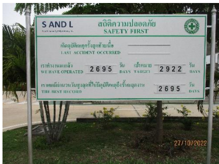
ภาพที่ 2.2-1 สถิติความปลอดภัย