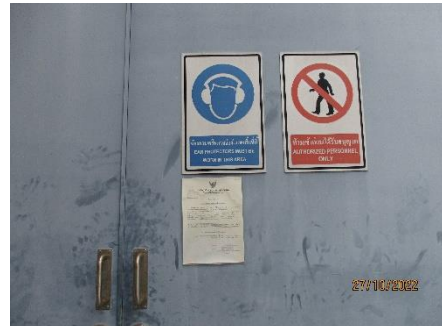
ภาพที่ 2.2-39 ป้ายเตือนอันตรายพื้นที่ ที่ต้องขออนุญาตเข้าทำงาน