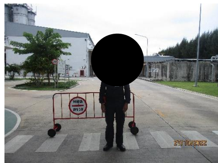
ภาพที่ 2.2-19 เจ้าหน้าที่บริเวณจุดตรวจผ่านเข้า-ออก