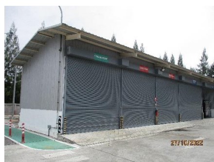
ภาพที่ 2.2-23 พื้นที่สำหรับจัดเก็บกากของเสีย