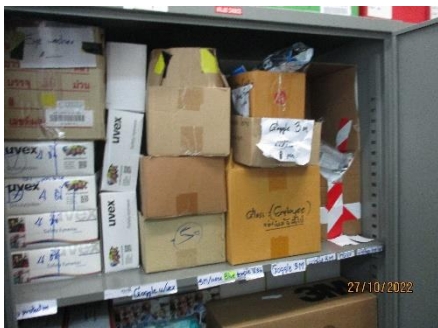
ภาพที่ 2.2-27 อุปกรณ์ป้องกันอันตรายส่วนบุคคล (PPE) พื้นฐาน สำหรับพนักงาน