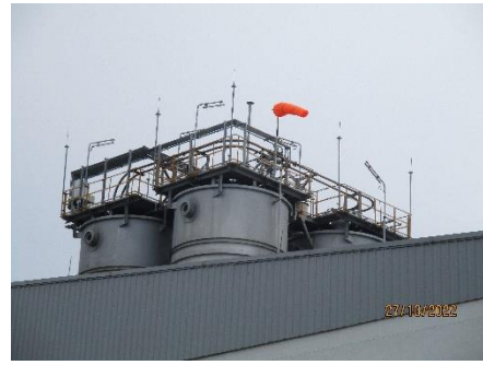
ภาพที่ 2.2-35 ถังลมบอกลักษณะทางลม