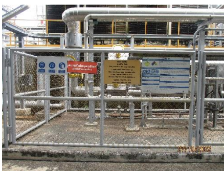
ภาพที่ 2.2-45 ป้ายสัญลักษณ์ ข้อความเตือนบริเวณแนวท่อ