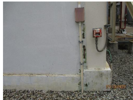
ภาพที่ 2.2-49 ติดตั้งสายกราวด์ลงดินตามมาตรฐานฯ