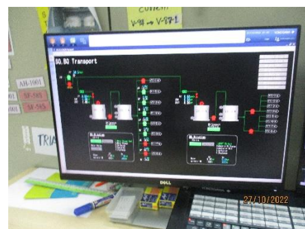
ภาพที่ 2.2-33 ติดตั้งอุปกรณ์ Level Switch