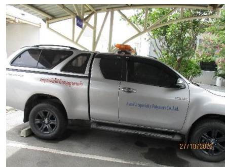
ภาพที่ 2.2-28 พาหนะสำรองกรณีฉุกเฉิน