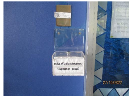
ภาพที่ 2.2-25 กล่องรับเรื่องร้องเรียน