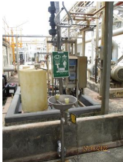
ภาพที่ 2.2-36 อ่างล้างตาและร่างกายในกรณีฉุกเฉิน