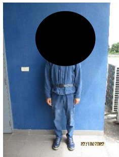
ภาพที่ 2.2-38 พนักงานสวมอุปกรณ์ป้องกัน ความปลอดภัย (PPE)