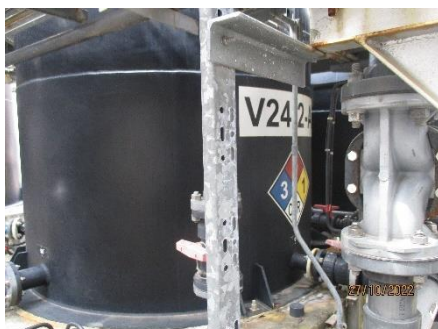
ภาพที่ 2.2-5 ถังสารละลาย NaOH 10% ที่มีการสำรอง