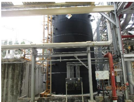
ภาพที่ 2.2-10 TDS Tank