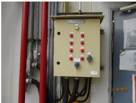
ภาพที่ 2.2-48 ระบบตรวจจับ