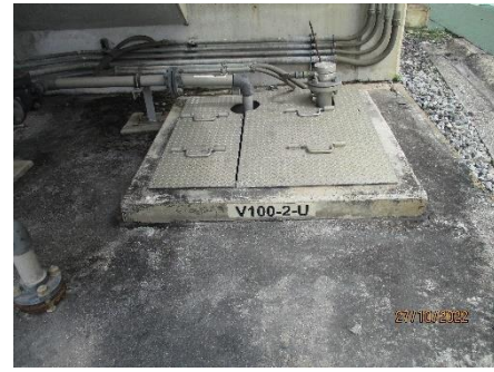
Inspection Pit (V100-2-U)