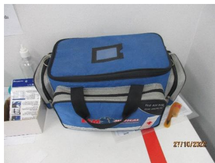
ภาพที่ 2.2-30 ห้องปฐมพยาบาล อุปกรณ์ปฐมพยาบาล และเวชภัณฑ์