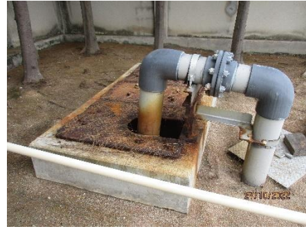
ภาพที่ 2.2-8 ถังรวบรวมน้ำเสีย Waste Water Inspection Pit (V89-N)