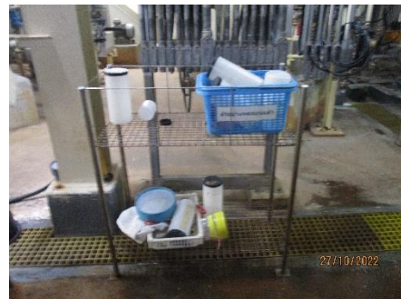
ภาพที่ 2.2-53 ถาดรองรับการระบายของเหลว