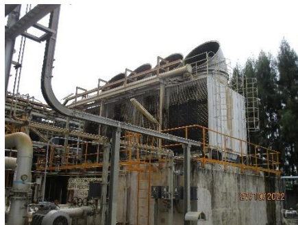
ภาพที่ 2.2-12 หอมผลิตน้ำหล่อเย็น (Cooling Water Blow down)