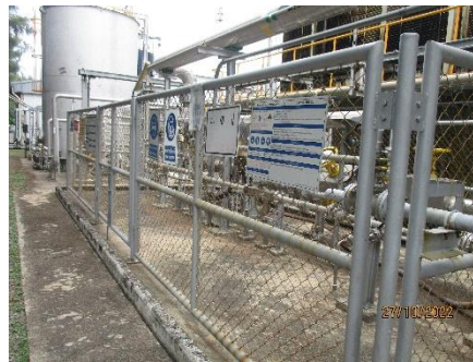
ภาพที่ 2.2-43 การปิดกั้นพื้นที่ตลอดแนวการวางท่อ