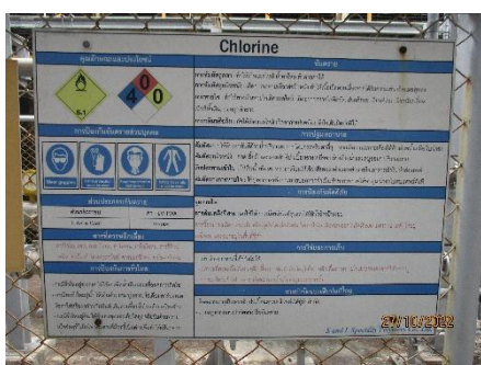
ภาพที่ 2.2-22 ข้อมูลความปลอดภัยในการทำงาน เกี่ยวกับสารเคมี