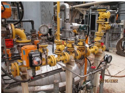
ภาพที่ 2.2-40 อุปกรณ์ตรวจสอบและป้องกันการรั่วไหลของก๊าซคลอรีน