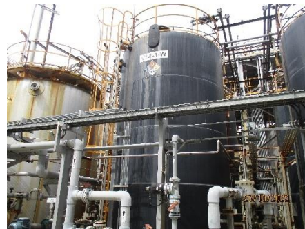
ภาพที่ 2.2-11 HCL Storage Tank