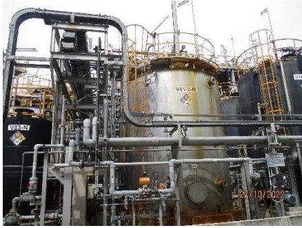
ภาพที่ 2.2-7 บ่อปรับสภาพให้เป็นกลาง (Neutralization)