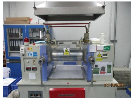
ภาพที่ 2.2-51 ภาพการติดตั้งระบบป้องกันไอสารเคมี (Filter)