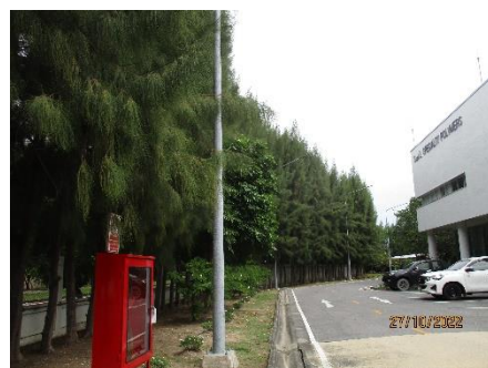
ภาพที่ 2.2-54 พื้นที่สีเขียวและแนวกันชน