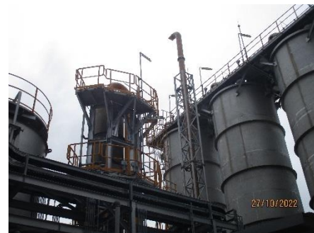
ภาพที่ 2.2-2 หอกำจัดคลอรีน (Chlorine Eliminator)