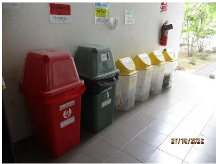
ภาพที่ 2.2-24 ภาพขยะแยกตามประเภทของมูลฝอย