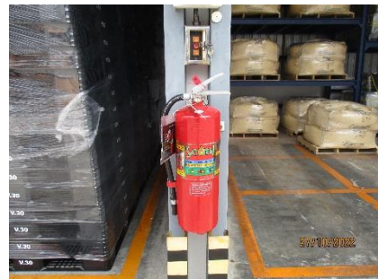
ภาพที่ 2.2-31 ระบบป้องกันและระงับอัคคีภัย