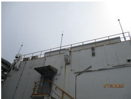
ภาพที่ 2.2-50 ติดตั้งสายล่อฟ้าตามมาตรฐานฯ