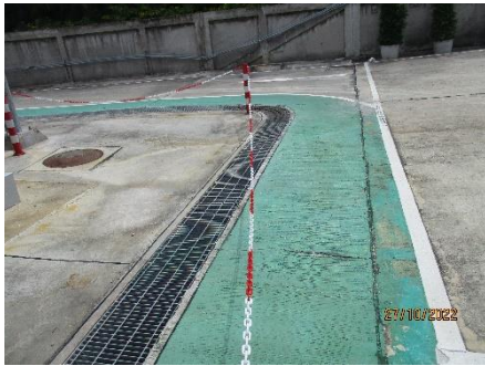
ภาพที่ 2.2-41 สิ่งก่อสร้าง (Barrier) ป้องกันการเกิดอุบัติเหตุจากยานพาหนะ