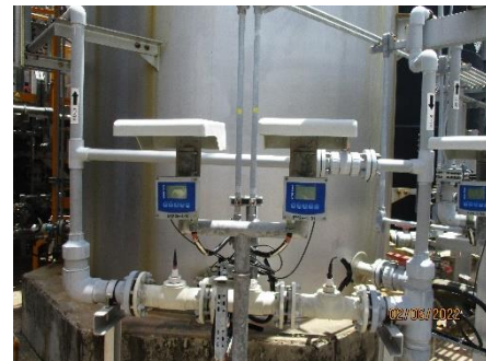
ภาพที่ 2.2-15 อุปกรณ์ ORP Sensor