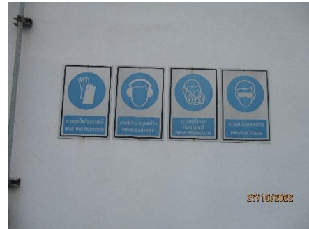
ภาพที่ 2.2-29 ป้ายเตือนการสวมใส่อุปกรณ์ป้องกันอันตรายส่วนบุคคล