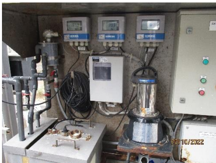
ภาพที่ 2.2-14 เครื่องมือวิเคราะห์อย่างต่อเนื่อง (Online-Analyzer)