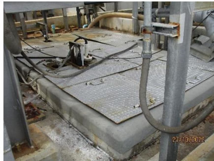
ภาพที่ 2.2-9 ถัง Waste Water Inspection Pit (V96-N)