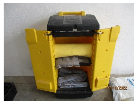
ภาพที่ 2.2-46 อุปกรณ์ควบคุมกรณีสารเคมีหกั่วไหล