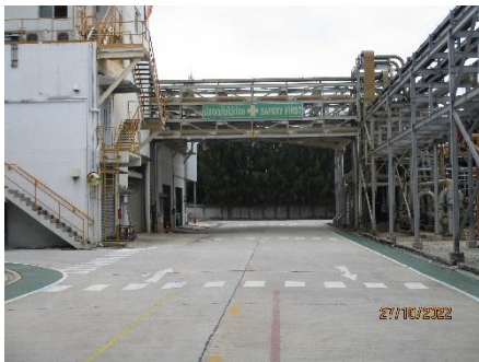
ภาพที่ 2.2-44 พื้นที่โล่งโดยรอบแนวการวางท่อ