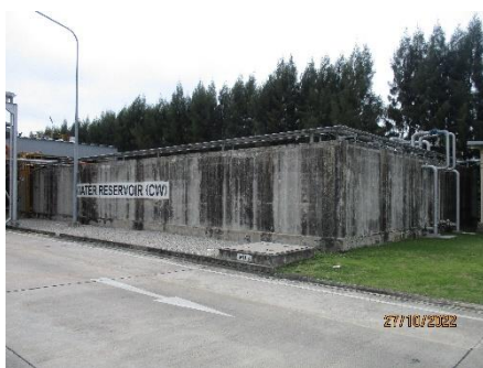
ภาพที่ 2.2-32 บ่อน้ำสำรองขนาด 1,200 ลูกบาศก์เมตร