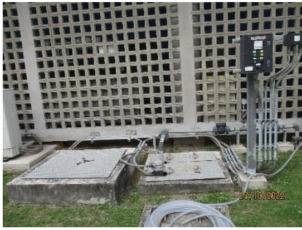
Inspection Pit (V100-1-U)