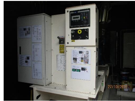
ภาพที่ 2.2-42 แหล่งพลังงานสำรอง (Back up Electrical Generator)