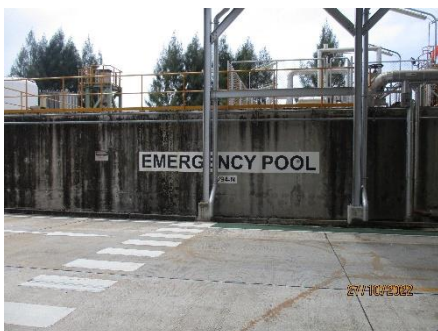
ภาพที่ 2.2-16 บ่อพักน้ำฉุกเฉินขนาด 1,500 ลูกบาศก์เมตร