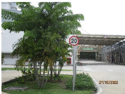
ภาพที่ 2.2-18 ป้ายจำกัดความเร็ว 20 กิโลเมตร/ชั่วโมง ภายในพื้นที่โครงการ