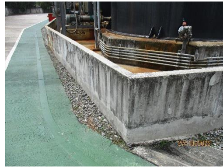
ภาพที่ 2.2-37 คันกัน (Dike) คอนกรีตล้อมรอบ ถังเก็บสารเคมีบริเวณถัง