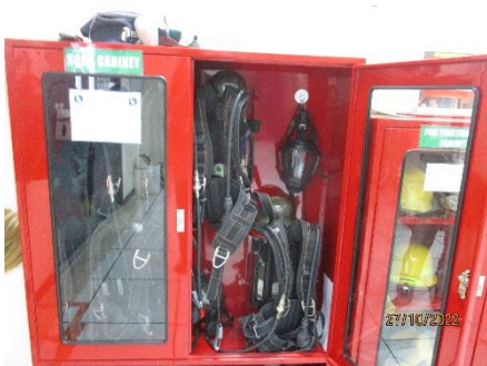
ภาพที่ 2.2-52 อุปกรณ์เครื่องช่วยหายใจและ หน้ากากป้องกันแก๊สพิษ