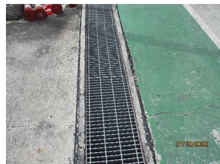
ภาพที่ 2.2-17 รางระบายน้ำฝนภายในโครงการ