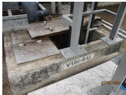
Inspection Pit (V100-4-U)