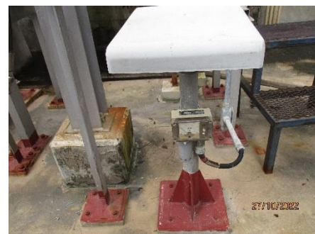
ภาพที่ 2.2-4 เครื่องตรวจวัดคลอรีน (Chlorine Gas Detector)