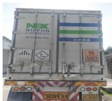
ภาพที่ 2.2-21 รายละเอียดบนตัวรถที่บรรทุกสารเคมี/ ผลิตภัณฑ์