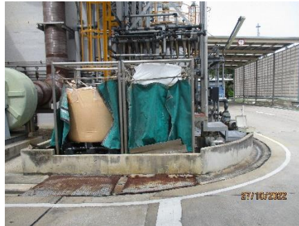
ภาพที่ 2.2-47 ถาดรองถุง Jumbo Bag