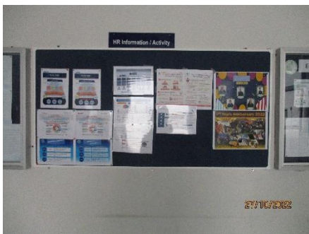
ภาพที่ 2.2-26 บอร์ดประชาสัมพันธ์เกี่ยวกับการดำเนินงานด้านความปลอดภัย