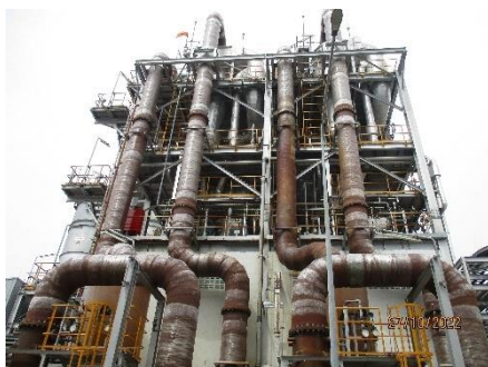
ภาพที่ 2.2-3 Wet Scrubber